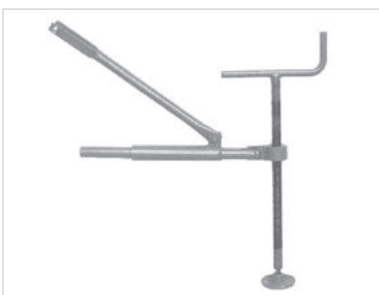
Zusatz-Hebespindel nur für HR, HK und HSA

(Nicht mit Normalzange DH-EW/05 verwenden)