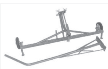
Variante Klappgriff KG