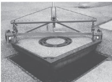
Schachtdeckel Hebewagen HK für Kabelschachtdeckel, rechteckige und quadratische Schachtdeckel sowie alle gängigen Runddeckel bis max. Ø 115 cm