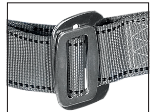
Steckverschluss (Brust), galvanisch verzinkt