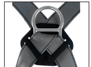
Auffangöse (D-Ring), geschmiedeter Stahl