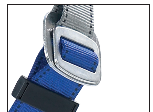
Steckverschluss (Bein), galvanisch verzinkt